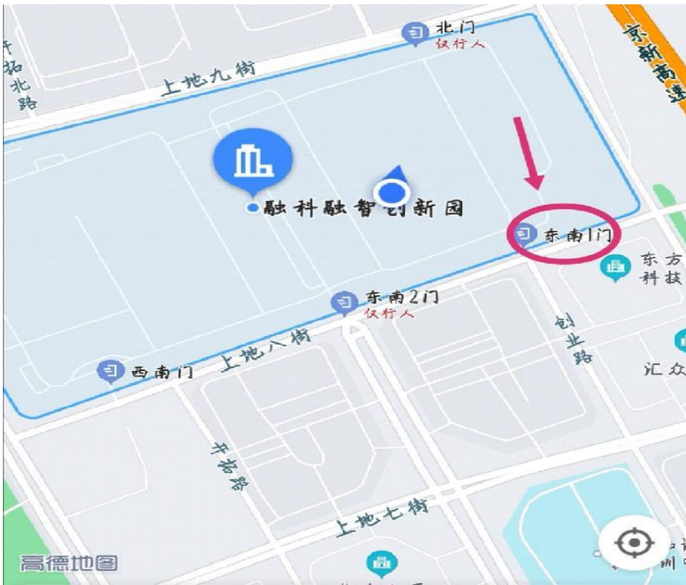
外景：融科融智创新园（东南1门）及门岗入口：